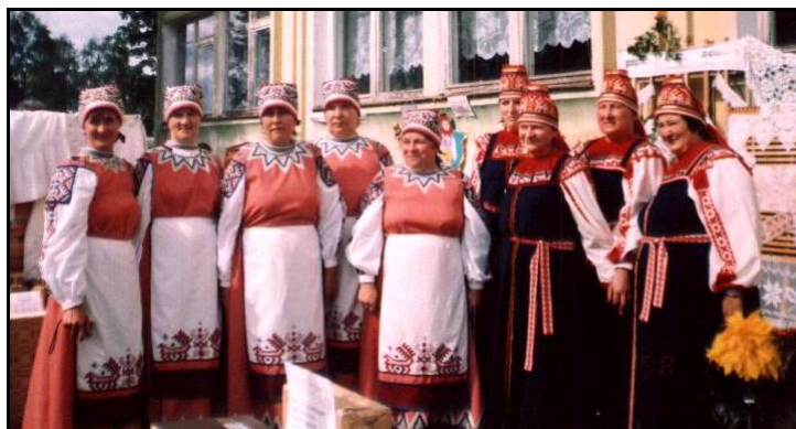
участники VII областного фестиваля карельской культуры

жественных, бытовых материалов строится многое в деятельности библиотеки. Библиотека выступила инициатором Дней карельской культуры в селе Козлово, которые со временем стали доброй традицией. Они проходят ежегодно в марте – апреле, длятся 7-10 дней и собирают людей в библиотеке. Первые были проведены в марте 1996 года. Главная задача – показать, что карельская культура имеет не только прошлое, но и будущее, разбудить интерес молодых к культуре предков, побуждать их к освоению национального наследия.